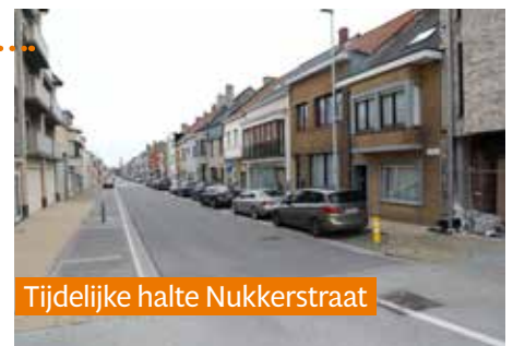
Tijdelijke halte Nukkerstraat