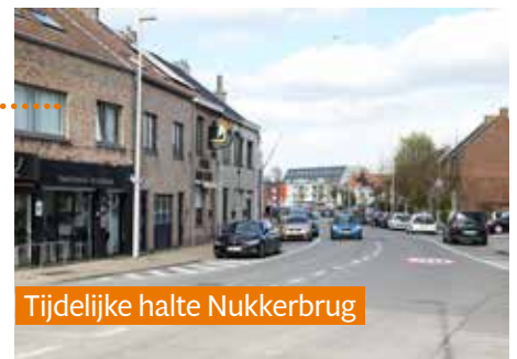
Tijdelijke halte Nukkerbrug