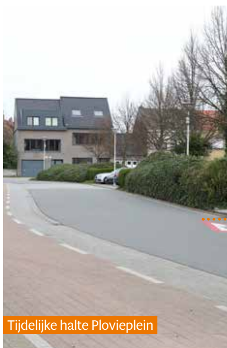
Tijdelijke halte Plovieplein